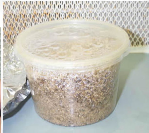
Wypalamy igłę od strzykawki i zdejmujemy cynfolię.