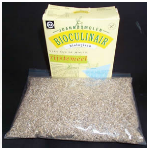
Dwa główne składniki: wermikulit i mąka z brązowego ryżu.