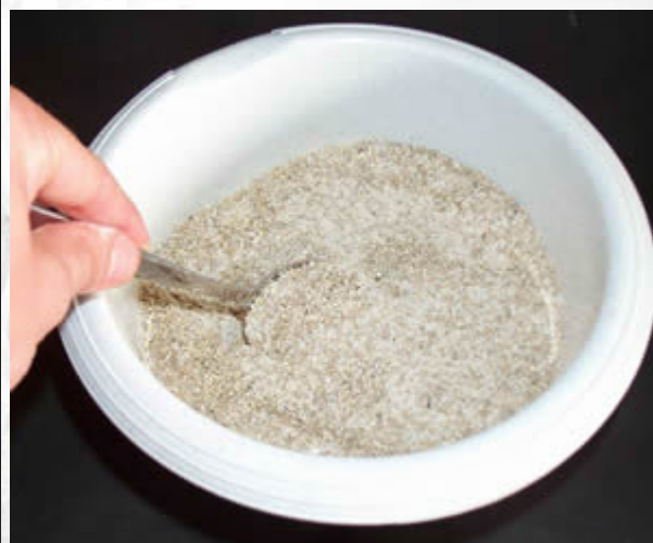
Najpierw mieszamy suche składniki: 4 kubki wermikulitu, 1.5 kubka mąki ryżowej.