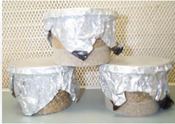
Pojemniki muszą ostygnąć: