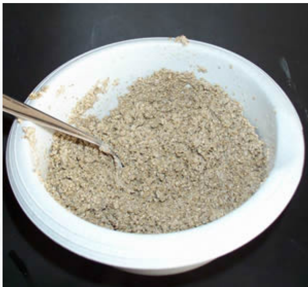
Tak wygląda gotowa mieszanka.