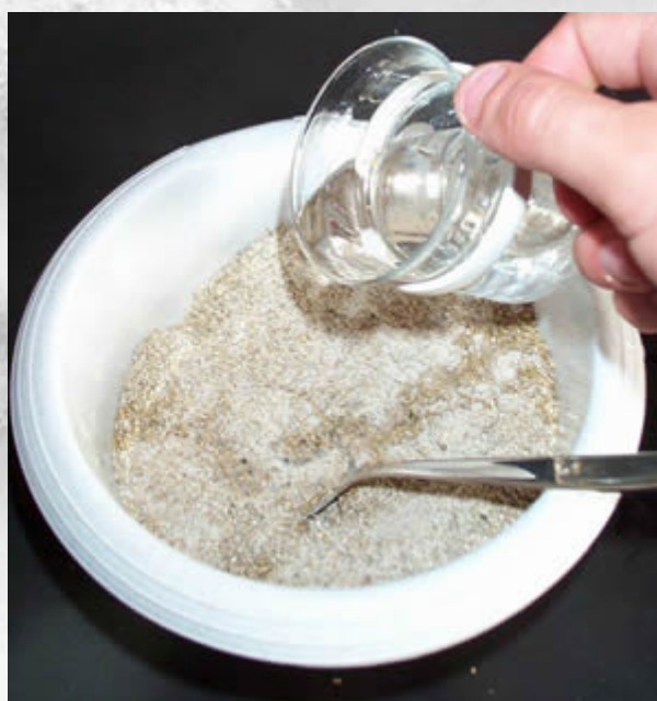
Dodajemy dwa kubki wody i dokładnie wszystko mieszamy: